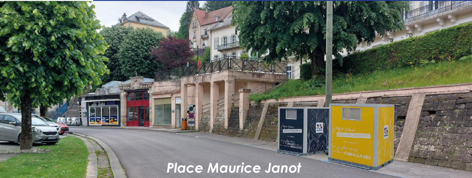
Place Maurice Janot

Dans le cadre de sa politique communale de développement du tourisme, programme « Petite Ville de Demain », la commune de Plombières les Bains souhaite améliorer son cadre de vie.